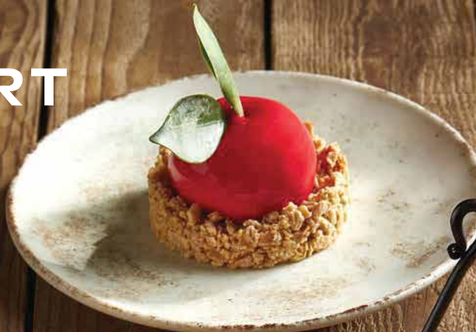
RED APPLE PIE