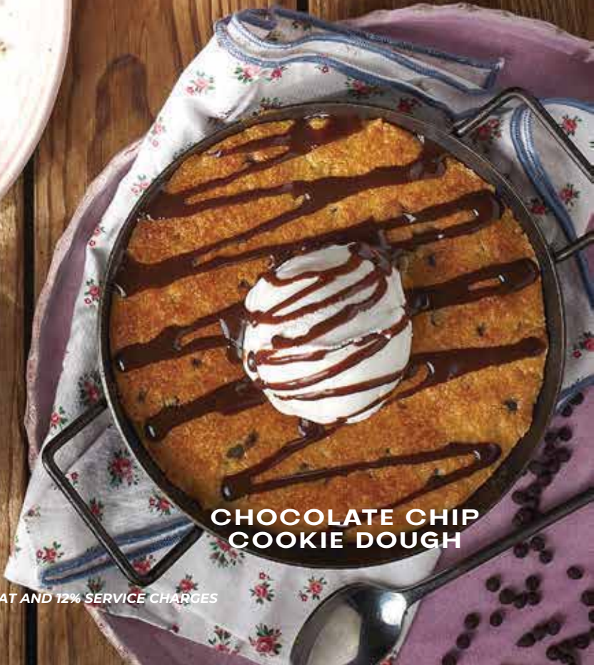
CHOCOLATE CHIP COOKIE DOUGH