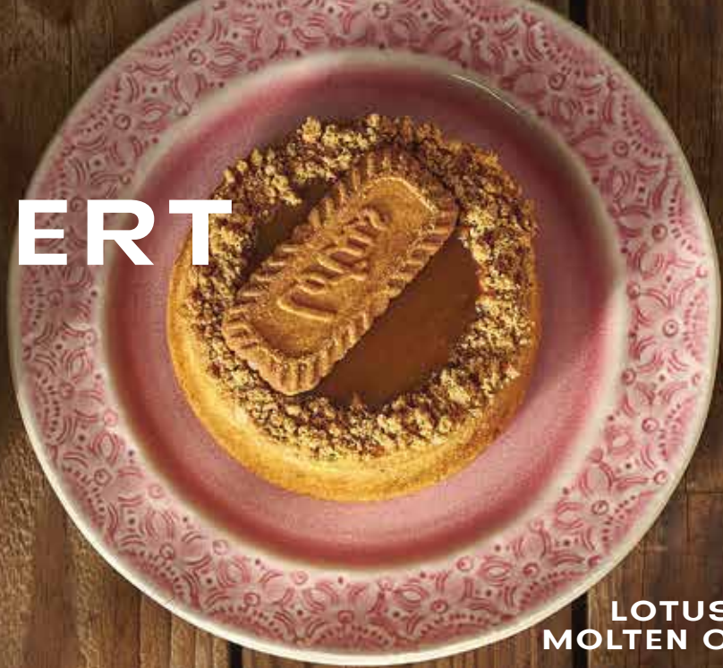
LOTUS MOLTEN CAKE